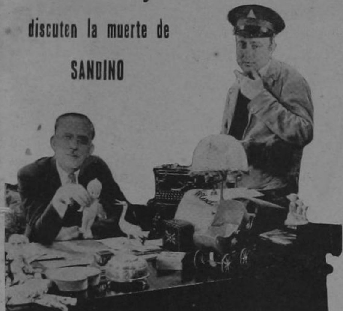
En este truco aparecen el doctor don Juan Bautista Sacasa, ex-Presidente de Nicaragua, y el General Somoza, actual gobernante de ese país. El primero de ellos se indignó (Pasa a la pág. CUATRO).