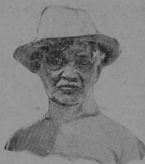
"YEGUITAS" El candidato