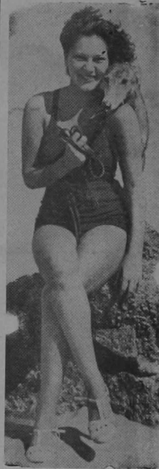
Y después dicen que hay problema de subsistencias...