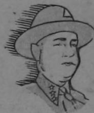
¡Que vengas bien, mientras vengas solo...!