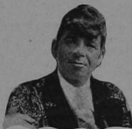
"RAFAELITO" El Jefe de Acción

RAFAELITO aceptará la Jefatura de Acción