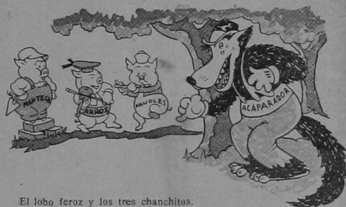
El lobo feroz y los tres chanchitos.